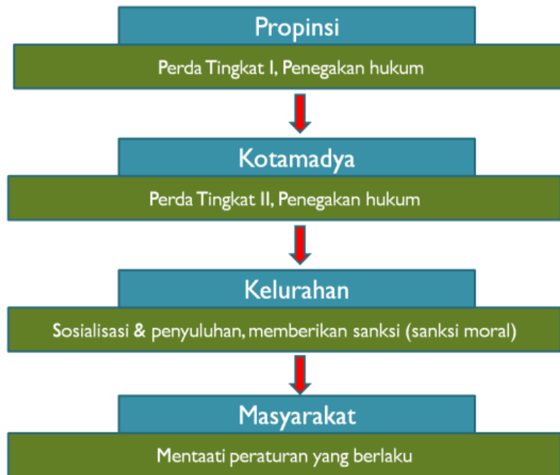
Gambar 2. Model Top-down

Model pemerdayaan masyarakat yang dirancang bersifat bottom-up dan top-down . Model yang bersifat top-down berpegang pada peraturan yang ada, sehingga masyarakat dipaksa harus mentaati peraturan yang ada dengan memberi sanksi bagi yang melanggar (Gambar 1)