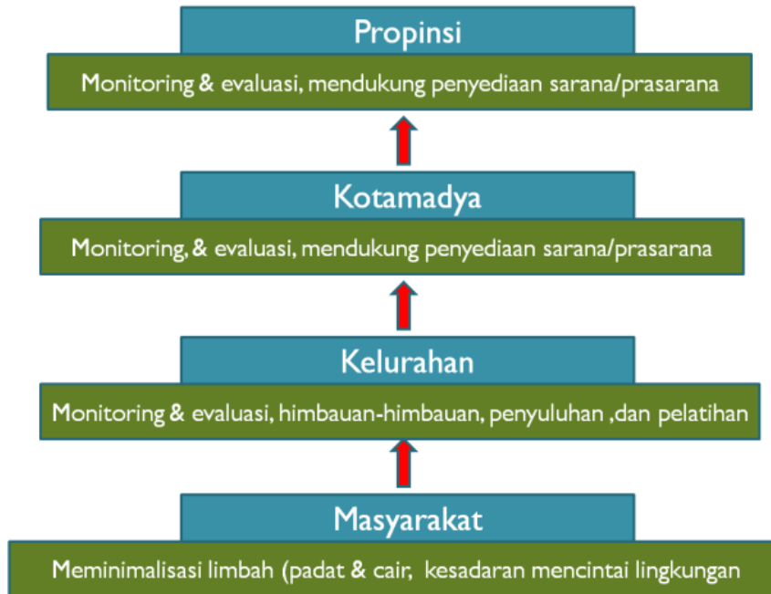
Gambar 3. Model Bottom-up

Kedua model di atas jika diterapkan di masyarakat, masing-masing memiliki kekurangan yang menyebabkan ketidakefektifan pelaksanaan pemberdayaan. Model yang paling efektif adalah model yang merupakan kolaborasi keduanya sehingga saling melengkapi kekurangan yang ada.