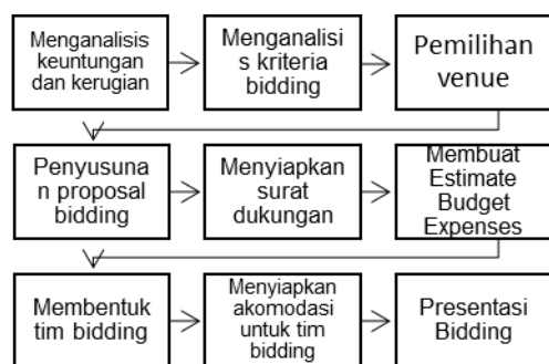
Gambar 2. Flow Chart Kegiatan Persiapan Bidding

Kegiatan yang dilakukan oleh Rajawali Convex pada bidding konferensi asosiasi: 2021 Asia Pacific Cities Summit & Mayor's Forum di Brisbane, Juli 2019 adalah sebagai berikut: