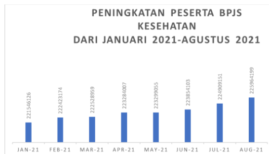
Gambar 1 Peningkatan Jumlah Peserta BPJS Kesehatan dari Januari 2021 hingga Agustus 2021

Usaha untuk memenuhi kebutuhan kesehatan bagi masyarakat Indonesia yang jumlahnya mencapai dua ratus jiwa tentu bukanlah hal yang mudah. Salah satu strategi pembangunan kesehatan nasional adalah menerapkan pembangunan nasional berwawasan kesehatan, yang berarti setiap upaya pembangunan harus mempunyai kontribusi positif terhadap lingkungan yang sehat dan perilaku yang sehat.